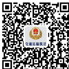
危险货物运输道路运输证 核发、换发、补发、审...

②网上办：沈阳政务服务网： http://zwfw.shenyang.gov.cn