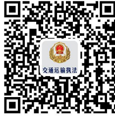
沈阳市政务服务中心交通 运输窗口联系方式