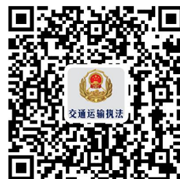
违规禁办事项清单